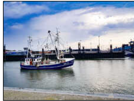
Fischkutter im Norddeicher Hafen

Den Strand, eine Drachen- und Spielwiese sowie das Haus des Gastes, die Kurklinik mit Kurpark erreichen Sie in nur wenigen Gehminuten. Von dort gelangen Sie auch schnell zu dem Erlebnisbad Ocean-Wave, dem schön gestalteten Wellenpark mit Seehund-Aufzuchtstation, dem Abenteuerspielplatz, Irrgarten, Minigolfplatz und dem Kinderspielhaus. Norden-Norddeich ist ein staatlich anerkanntes Nordseeheilbad und entwickelte sich vom Fischerdorf zu einem beliebten Küstenbadeort. In den vergangenen Jahren entstanden eine grosszügig angelegte Kuranlage, die Kurklinik, das Therapiezentrum, die Deichpromenade und das Haus des Gastes.