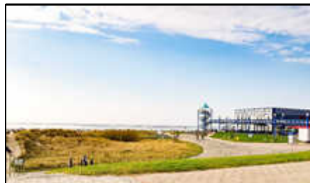
Strand - Haus des Gastes

Den Strand, eine Drachen- und Spielwiese sowie das Haus des Gastes, die Kurklinik mit Kurpark erreichen Sie in nur wenigen Gehminuten. Von dort gelangen Sie auch schnell zu dem Erlebnisbad Ocean-Wave, dem schön gestalteten Wellenpark mit Seehund-Aufzuchtstation, dem Abenteuerspielplatz, Irrgarten, Minigolfplatz und dem Kinderspielhaus. Norden-Norddeich ist ein staatlich anerkanntes Nordseeheilbad und entwickelte sich vom Fischerdorf zu einem beliebten Küstenbadeort. In den vergangenen Jahren entstanden eine grosszügig angelegte Kuranlage, die Kurklinik, das Therapiezentrum, die Deichpromenade und das Haus des Gastes.