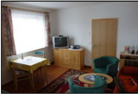
Wohnzimmer FeWo Ilse