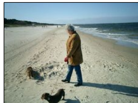
Der Zinnowitzer Ostseestrand im Oktober