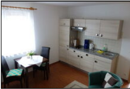
Wohnküche in der FeWo Günther