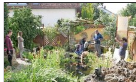
Dreharbeiten des ZDF in unserem Garten

Unser Garten wurde bereits zwei Mal in Gartenmagazinen vorgestellt, ein Fernsehteam vom ZDF hat hier Aufnahmen gemacht und der Bayerische Rundfunk hat berichtet!