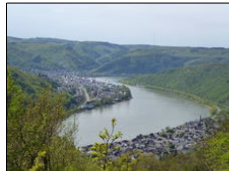
Rheinblick über Kamp-Bornhofen

Der Wallfahrtsort Kamp-Bornhofen liegt in Mitten des Unesco Weltkulturerbes im Oberen Mittelrheintal und bietet eine sehr gute Ortsanbindung mit Bus und Bahn, sowie mit dem Schiffsverkehr. Unser idyllisch gelegener Ort wie auch die nähere Umgebung, bieten zahlreiche Freizeitaktivitäten und Sehenswürdigkeiten. Entspannen, Natur erleben, die Seele baumeln lassen und sich wie zu Hause fühlen, das ganze Jahr ein lohnendwerter Besuch in unserer schönen Gemeinde. Mehr Infos im Web "Kamp-Bornhofen"