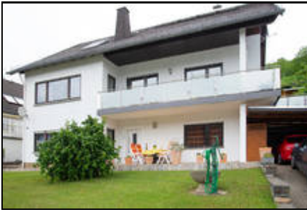
Ferienwohnung mit Terrasse im Erdgeschoß