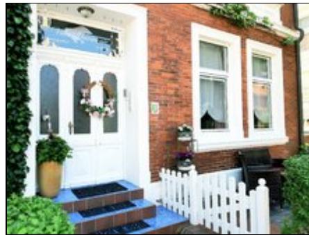
Willkommen in der Villa Harmonie

Die "Villa Harmonie" liegt direkt im alten Ortskern, zum Hauptbadestrand laufen sie ca. 8 Minuten, zum Gezeitenland ebenfalls. Der Fahrradverleih ist direkt um die Ecke, die Bäckerei ebenfalls und das Krankenhaus befindet sich für den Notfall nur 2 Strassen entfernt. Sie sehen, Strand, Shopping und absolute Ruhe ist garantiert :-)