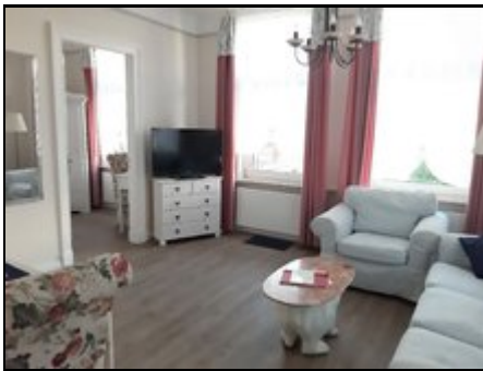
Wohnküche mit Blick ins Zusatzzimmer