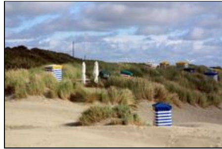
Der Strand ganz in der Nähe

Die "Villa Harmonie" liegt direkt im alten Ortskern, zum Hauptbadestrand laufen sie ca. 8 Minuten, zum Gezeitenland ebenfalls. Der Fahrradverleih ist direkt um die Ecke, die Bäckerei ebenfalls und das Krankenhaus befindet sich für den Notfall nur 2 Strassen entfernt. Sie sehen, Strand, Shopping und absolute Ruhe ist garantiert :-)