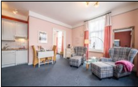
Gemütliches Wohn-/ Esszimmer