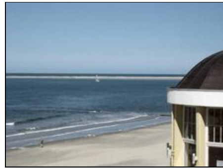
8 Minuten Fussweg zur Promenade

Die "Villa Harmonie" liegt direkt im alten Ortskern, zum Hauptbadestrand laufen sie ca. 8 Minuten, zum Gezeitenland ebenfalls. Der Fahrradverleih ist direkt um die Ecke, die Bäckerei ebenfalls und das Krankenhaus befindet sich für den Notfall nur 2 Strassen entfernt. Sie sehen, Strand, Shopping und absolute Ruhe ist garantiert :-)