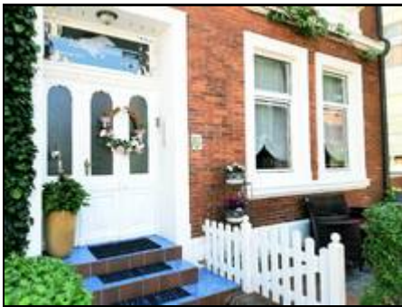
Willkommen in der Villa Harmonie