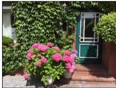
Ihr eigener Eingang

Die "Villa Harmonie" liegt direkt im alten Ortskern, zum Hauptbadestrand laufen sie ca. 8 Minuten, zum Gezeitenland ebenfalls. Der Fahrradverleih ist direkt um die Ecke, die Bäckerei ebenfalls und das Krankenhaus befindet sich für den Notfall nur 2 Strassen entfernt. Sie sehen, Strand, Shopping und absolute Ruhe ist garantiert :-)