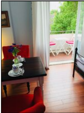
Frühstück im Grünen