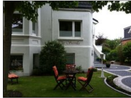
Die Villa in sehr ruhiger Umgebung

In direkter Nähe finden sie (zwei Strassen weiter) die Shopping-meile mit vielen kleinen Läden und Kneipen. Auch der Einkaufsladen Edeka ist nur 8 Minuten Fussweg entfernt. Genau gegenüber das Restaurant "Teehaus". Gut essen im Wintergarten oder bei Kerzenschein ist ein Erlebnis .-) Der Südstrand ist ca. 8 Minuten entfernt, das Meer ist nah :-) Kurze Wege garantiert, das ist der Vorteil, wenn man in der Altstadt wohnt. Sie sind in wenigen Minuten in der Fussgängerzone, sind in der Nähe des Strandes und der Kurpark ist auch eben um die Ecke .-) Unser neues Krankenhaus befindet sich zwei Strassen entfernt, nur die entgegengesetzte Richtung.