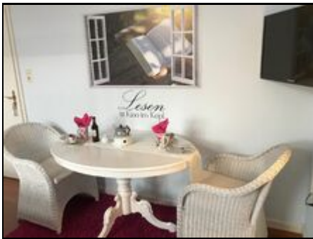
Herzlich willkommen .-)