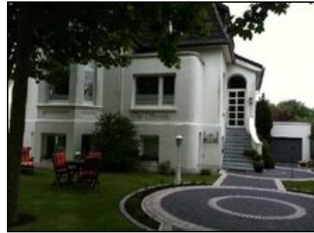
Aussen schön und innen schön :-)

In direkter Nähe finden sie (zwei Strassen weiter) die Shopping-meile mit vielen kleinen Läden und Kneipen. Auch der Einkaufsladen Edeka ist nur 8 Minuten Fussweg entfernt. Genau gegenüber das Restaurant "Teehaus". Gut essen im Wintergarten oder bei Kerzenschein ist ein Erlebnis .-) Der Südstrand ist ca. 8 Minuten entfernt, das Meer ist nah :-) Kurze Wege garantiert, das ist der Vorteil, wenn man in der Altstadt wohnt. Sie sind in wenigen Minuten in der Fussgängerzone, sind in der Nähe des Strandes und der Kurpark ist auch eben um die Ecke .-) Unser neues Krankenhaus befindet sich zwei Strassen entfernt, nur die entgegengesetzte Richtung.