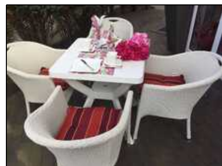
Ihre Terrasse mit schönen Gartenmöbeln

Sollten sie im Urlaub waschen müssen, wir machen das natürlich gerne.:-)