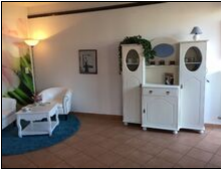
Viel Komfort, obere Etage