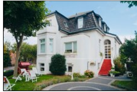
Die Seevilla von aussen

In direkter Nähe finden sie (zwei Strassen weiter) die Shopping-meile mit vielen kleinen Läden und Kneipen. Auch der Einkaufsladen Edeka ist nur 8 Minuten Fussweg entfernt. Genau gegenüber das Restaurant "Teehaus". Gut essen im Wintergarten oder bei Kerzenschein ist ein Erlebnis .-) Der Südstrand ist ca. 8 Minuten entfernt, das Meer ist nah :-) Kurze Wege garantiert, das ist der Vorteil, wenn man in der Altstadt wohnt. Sie sind in wenigen Minuten in der Fussgängerzone, sind in der Nähe des Strandes und der Kurpark ist auch eben um die Ecke .-) Unser neues Krankenhaus befindet sich zwei Strassen entfernt, nur die entgegengesetzte Richtung.