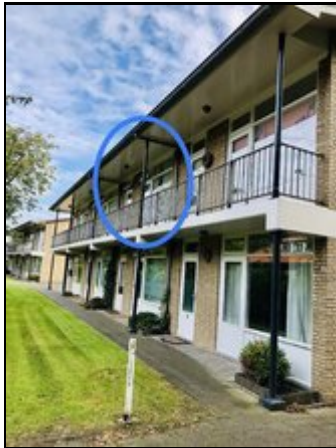
Wohnung Vroonweg 14