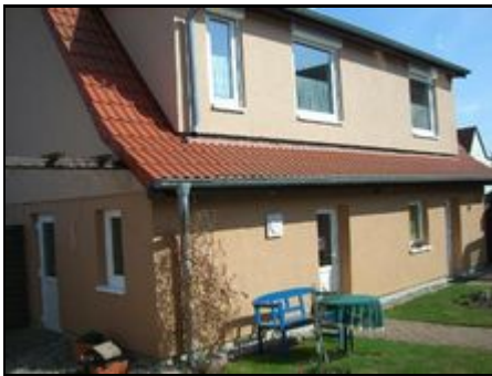
Wohnung unten, Eingang Mitte Gebäude