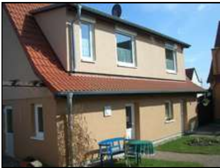
hier fängt der Urlaub an