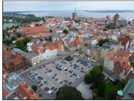
Blick von der Marienkirche in Stralsund