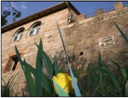
Fenster zur Küche, Zinnen der Terrasse