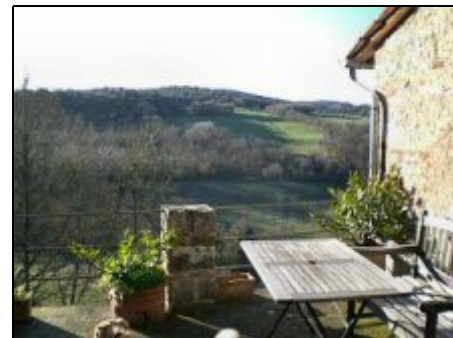
... auf Wald, Wiesen und Ziegenweiden

Nur eine halbe Stunde Fahrt durch grüne Hügel und Sie sind da - im bezaubernden SIENA, mit dem schönsten Platz Italiens - dem weltberühmten CAMPO, Schauplatz des historischen PALIO. Das Meer bei CASTIGLIONE della Pescaia oder FIRENZE, SAN GIMIGNANO, MONTALCINO mit dem romanischen Juwel SANT ANTIMO, das etruskische MURLO, die Fresken im Kreuzgang des Klosters MONTE OLIVETO, das romantische Renaissance-Kleinod