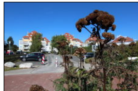
Der Strandpark vom Strand aus gesehen

Als Ausflugsziele bieten sich an die Insel Fehmarn, Heiligenhafen, die Küstenstädte an der Lübecker Bucht, der Hansapark in Grömitz oder auch die Karl-May-Festspiele in Bad Segeberg an.