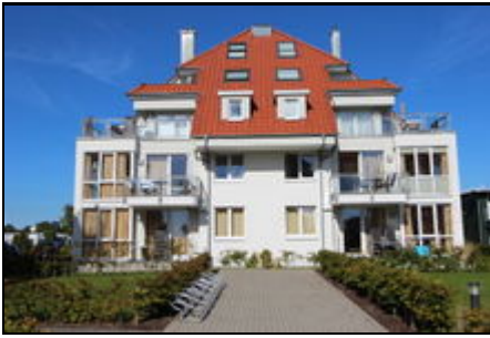
Ihre Wohnung im 1. Stock rechts