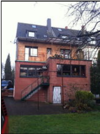
Dachwohnung vom Garten aus