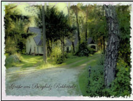
Willkommen in Bergholz-Rehbrücke