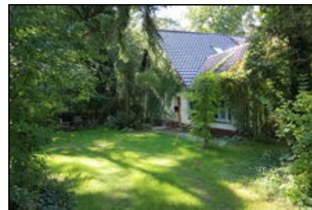
Mitten in der Natur

Für Menschen, die sich an der Natur genauso erfreuen können, wie an den phantastischen Möglichkeiten einer lebendigen Stadt, ist dieses Domizil ideal. Das Waldgrundstück garantiert Ruhe und Entspannung. Für Jogger, Fahrradfahrer oder für ausgedehnte Spaziergänge entlang der Nuthewiesen, bietet die reizvolle Umgebung alles was man braucht, um den anstrengenden Alltag hinter sich zu lassen und neue Kraft zu tanken.