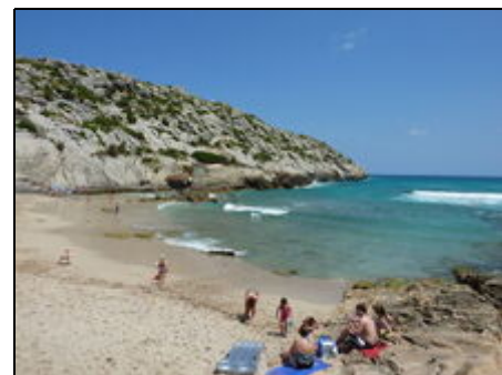
Cala San Vicente

Für Urlauber, die das ursprüngliche Mallorca suchen, sind Pollensa und das gleichnamige Hafentstädtchen Puerto Pollensa ideale Rückzugsorte. Weit weg vom Ballermann verschmelzen hier abwechslungsreiche Landschaften mit gepflegten Sandstränden. Pollensa ist ein guter Ausgangspunkt für Erkundungen der gesamten Insel und das Tramuntana-Gebirge eignet sich hervorragend für Wander- und Radwandertouren.