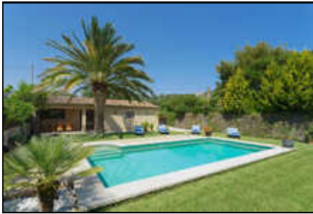
Ferienhaus mit Pool in Pollensa Stadt