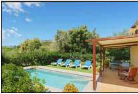
Finca mit Pool in Pollença