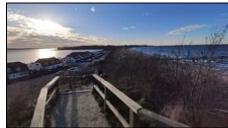
Salzhaff und Ostsee

Genießen Sie Ihren Urlaub im Ostseebad Rerik auf der Landzunge zwischen dem Salzhaff und der Ostsee mit herrlichem Sandstrand, der Seebrücke und der romantischen Steilküste. Mit nur 2.400 Einwohnern wird die kleine ehemalige Fischerstadt noch immer als Geheimtipp gehandelt. Die alte Fischerkirche bildet den Mittelpunkt. Der Haffplatz und die Promenade laden zum Verweilen ein. Cafés, Eisdiele, eine Pizzeria und verschiedene Restaurants bieten Speisen und Getränke an. Kleine Geschäfte laden zum Bummeln ein. Einkaufen kann man in zwei Supermärkten, frischer Fisch ist bei den Fischern im Ort erhältlich. Post, Sparkasse und eine Bank fehlen auch nicht. Von der Wohnung ist alles gut zu erreichen.