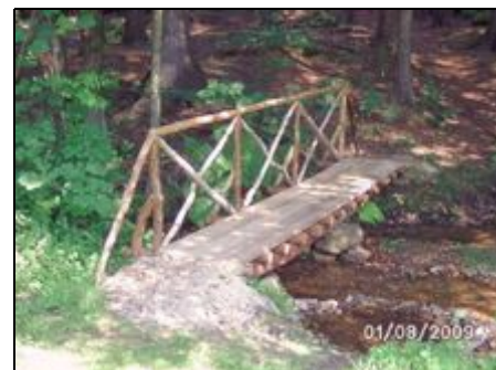
Brücke am Kwai (Schaufelbach)

Der Luftkurort Waldmünchen liegt an der Grenze zu Tschechien im Oberen Bayerischen Wald. Aus dem Böhmerwald grüsst der 1042 m hohe Cerchov. Glaskunst und -Verkaufsausstellungen wecken Neugier auf die "Glasstrasse". Der Perlsee Strand, das Erlebnisbad, die vielen Wanderwege, Mountainbike- und Radelstrecken, das gepflegte Winterskigebiet und die nahegelegene Golf-Anlage in Voithenberg sind Beispiele fuer erholsame Ferien. Brauchtumsfeste, Freilichfestspiele und Theater erfreuen im Sommer.