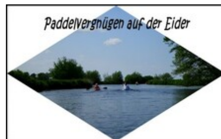
Traumhafte Bootstouren vor Ort

Dellstedt hat seinen ländlichen Charakter behalten. Viele Bauernhöfe prägen noch heute das Dorfbild. Eine Augenweide ist die restaurierte Bauernwindmühle. Außerdem genießen Sie hier die Weite grüner Wiesen sowie ca. 500 ha Naturschutzgebiet mit Aussichtsplattform und Wanderweg. Sogar die vitalisierende Frische von Nord- und Ostsee können Sie hier nach einer Autofahrt von ca. 30 - 50 Min. genießen. In Dellstedt finden Sie ein kleines Freibad, einen Kaufmann, einen Bäcker und einen EC-Autom.