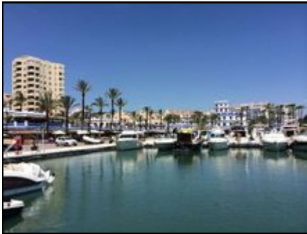
1. Linie am Yachthafen von Estepona