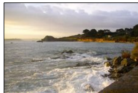
Blick auf das Ferienhaus Le Corbusier

Kleines Ferienhaus (ehemaliges Atelier von J. Savina, Pläne von le Corbusier), komplett renoviert mit Garten und grosser Sonnenterrasse, direkt am Meer mit Blick auf die Bucht und den Sandstrand von "Pors Hir" sowie die "unendliche" Weite des Meeres. Sehr gute Ausbaugqualität mit allem Komfort, gepflegtes Interieur. Ideale Lage: kurze Distanzen zum Badestrand, Restaurants und Einkaufsgeschäften. Vielfältige und abwechslungsreiche Wander- und Fahrradwege. Außergewöhnliche Lage in Naturschutzgebiet, sehr ruhig. Der ideale Ort, um "die Seele baumeln zu lassen".