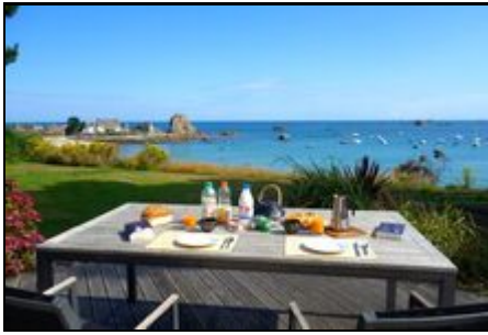
Frühstück auf der Terrasse