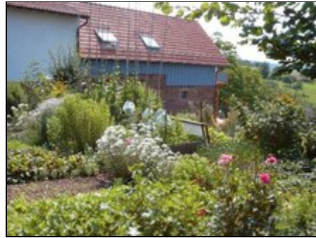
Fruchtspeicher mit Bauerngarten

Der Ferienhof liegt auf einer Sonnenterrasse, ca. 420m ü. Meeressp, am Ortsausgang von Rothenberg, einem wahren Wanderparadies. Mehrere Gastronomische Möglichkeiten in wenigen Minuten zu Fuß erreichbar. Rothenberg liegt auf einem Höhenzug des Odenwaldes, dem Hirschhorner Rücken. 8 Km bis zum Neckar, Burgenstraße, Heidelberg 28Km, Erbach 18Km, Michelstadt 20Km, Bad Wimpfen ca. 30Km.... Hier kann man einen Erholungsurlaub aber auch Aktivurlaub verbringen. Guter Ausgangspunkt für Sightseeingtours. Der Ferienhof verfügt über verschiedene Ferienwohnungen bzw. Ferienhäuser. Nähere Informationen finden Sie auf unserer Homepage siehe Kontaktdaten.