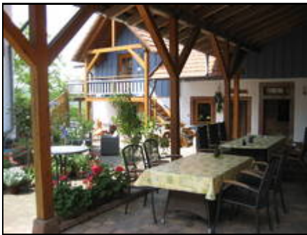
Innenhof mit Sitzmöglichkeiten