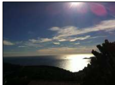
Blick auf das Meer

Der Belegungskalender ist immer aktuell. Reservierung direkt beim Besitzer. Geben Sie uns Ihre Postanschrift und E-Mailadresse und wir schicken Ihnen einen Mietvertrag. Eine Überweisung von 25% des Mietpreises ist bei Vertragsabschluss zu tätigen. Restzahlung und Kaution bei Ankunft.