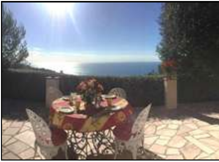
Meerblick von der sonnigen Terrasse