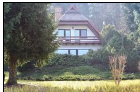
Außenansicht des Ferienhauses in Kolpin

Der Stadtrand von Berlin ist 25 km von Kolpin entfernt. Das