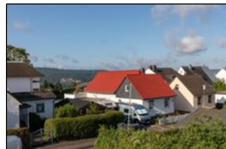
Die Nachbarschaft (Blick von Balkon)

Entfernungen zu Fuß: Einkaufszentrum 900m