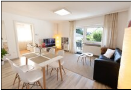
Das lichtdurchflutete Wohnzimmer