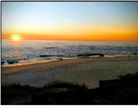
Amorosa Strand Abenddämmerung