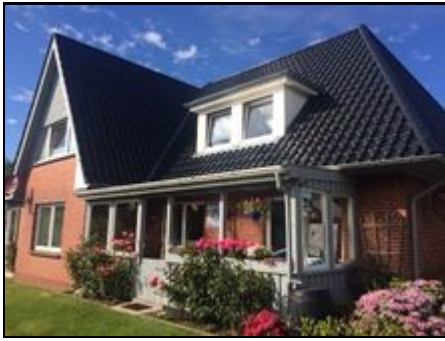
Unser Haus im Sommer