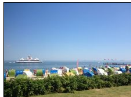
Sommersonne am Sandwall

Das Nordseeheilbad Wyk auf Föhr bietet Ihnen alles für einen erholsamen, abwechslungsreichen Urlaub. Ob lange Strandspaziergänge, einen Einkaufsbummel durch die gemütliche Wyker Innenstadt mit anschließendem Besuch des Meerwasser-Wellenbades, Kuranwendungen, Kino, Wassersport, eine Halligrundfahrt, Wattwanderungen im Nationalpark Wattenmeer, ein Besuch im neuen Museum "Kunst der Westküste" oder eine Radtour über die Inseldörfer, für jeden ist etwas dabei. Gute Erholung!