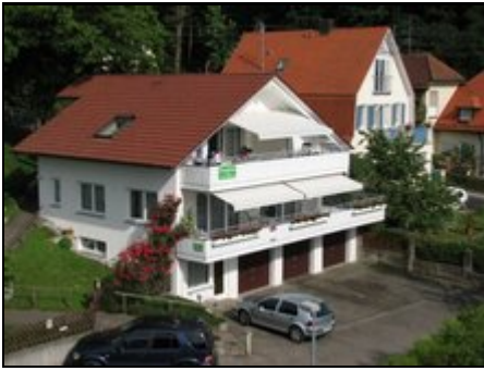
Aussenansicht, Haus Herter