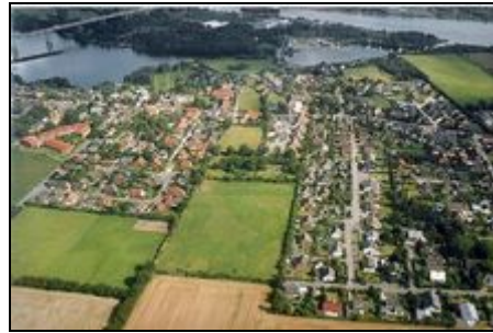
Blick auf Borgstedt

4 Minuten von der A7 entfernt und sehr idyllisch an der Eiderenge mit Naturstrandbad liegt das gemütliche Dorf Borgstedt. Durch den Dorfbäcker und vielen Einkaufsmöglichkeiten im Umkreis von 2 km ist man hier gut versorgt. Mitten im Dorf befindet sich der Hubertushof mit den Gästehäusern in einer kleinen Parkanlage. Traumhaft ist der direkte Blick auf die idyllisch gelegene Badestelle an der Eiderenge direkt am Nord-Ostsee-Kanal. Die Umgebung ist ideal zum Wandern, Radfahren, Angeln, Schwimmen usw