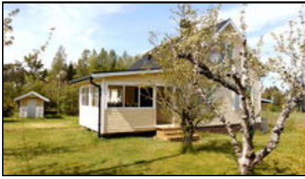
Haus am Vännersee