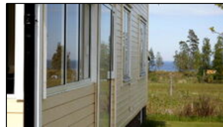
Zum Strand nur ca. 200m

Das Ferienhaus befindet sich in unmittelbarer Nähe vom Vännersee, wo man ausgezeichnet Baden, Surfen aber auch Angeln kann. Das Dalsland ist der schönste Teil von Schweden, weil man in Diesem die gesamte schöne Natur Schwedens in so konzentrierter Form vorfindet. Norwegen liegt nur eine Autostunde (ca. 80Km) entfernt. Auch Göteborg und Karlstad sind in 1,5h vom Haus aus erreichbar. Sie erreichen viele interessante Sehenswürdigkeiten in knapp einer halbstündigen Autofahrt. Das Ferienhaus ist im Dals Land in Westschweden und hat sehr viele Seen. Das Dalsland wird von den Schweden selbst als Minischweden betrachtet und ist für die Schweden ein bevorzugtes Urlaubsgebiet. Viel Wald Wasser und bergige Landschaft ..Sehr gute Einkaufsmöglichkeiten in Mellerud Vännersburg Amol . Auch ein Besuch Göteborgs ist mit dem Zug unproblematisch von Mellerud aus. Sie sparen sich den Stress mit dem Auto in der Grossstadt und Parkgebühren. Sie fahren mit dem Zug nur ca. 1h und sind im Zentrum.