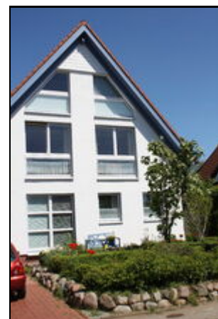
Schloßwohnung im 1.OG über 2 Ebenen

Ihre Freizeit ... kann direkt vor der Haustür beginnen. Der Appelwarder ist idealer Ausgangspunkt für Wanderausflüge, (der Europäische Fernwanderweg verläuft fast direkt vor dem Haus), für Dauerläufe und Nordic-Walking-Touren jeder Länge sowie für Ausfahrten mit dem Touren-, Renn- oder Mountainbike in die Holsteinische Schweiz. Ohne lärmige Hauptverkehrsstraßen passieren zu müssen, sind sie in kürzester Zeit mitten in der Natur oder auf dem Weg zur 30 Kilometer entfernten Ostsee.