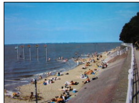
Der Strand beim alten Kurhaus

Dangast - das heißt Urlaub von Anfang an! Eines der ältesten Seebäder an der Nordseeküste erwartet Sie. Hier stehen noch alte Fischerhäuser und im kleinen Hafen schaukeln Segelboote auf den Wellen. Eine Fahrt mit der "Etta von Dangast" gehört zu den besonderen Vergnügungen. Der schöne Sandstrand bietet reichlich Platz zum Sonnen, Spielen und Baden - und natürlich für einen schönen Spaziergang in der herrlichen Natur. Für weitere Erkundungen bietet sich besonders das Radfahren an.