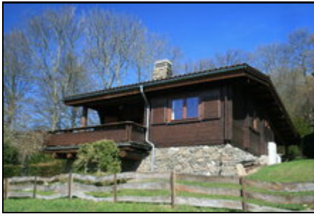
Hausansicht von Südosten