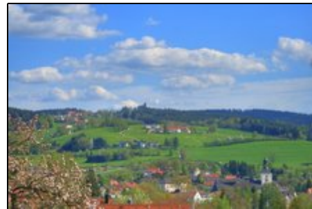
Ihre Aussicht von der Sonnenterrasse