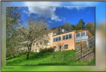
Ihr Gruppenhaus in Bayern