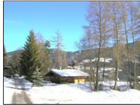
Chalet Astrid Winteransicht