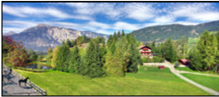
Ferienhaus mit Badesee und Reitplatz