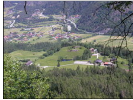
Panorama unserer Ferienanlage