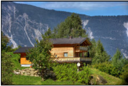
Landhaus Anna mit Wellnesshaus