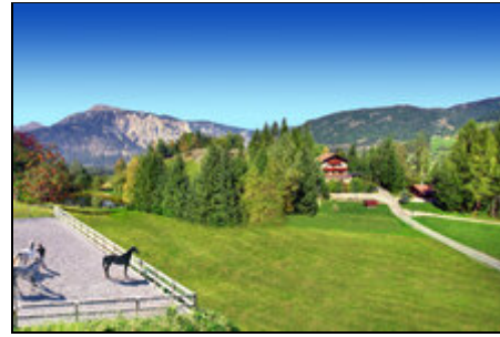
Ferienwohnungen mit Teich und Reitplatz