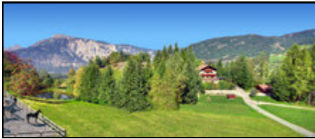
Ferienwohnungen u. Chalet Astrid 2008