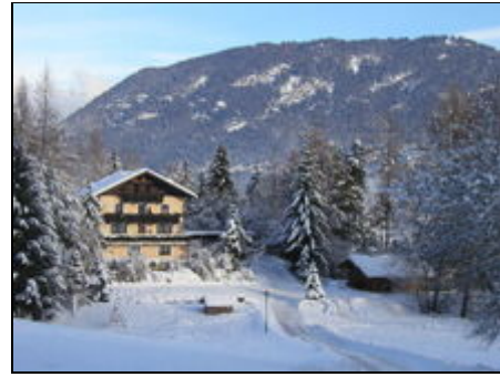
Ferienhaus und Chalet Astrid im Winter