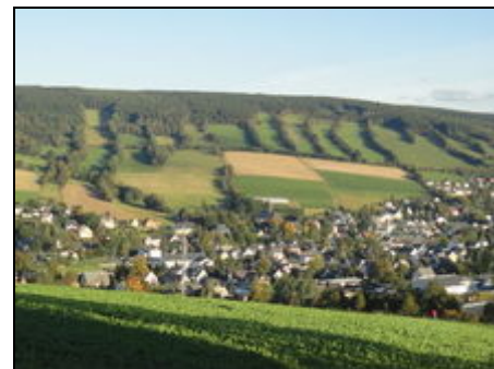
Unser Ort Königswalde

Im Oberen Erzgebirge können Sie alte Burgen besichtigen, sich durch interessante Besucherbergwerke führen lassen oder eine Fahrt mit der romantischen Kleinbahn (dampfbetriebene Schmalspurbahn) unternehmen. Auch Ausflüge nach Annaberg-Buchholz, zum Kurort Oberwiesenthal, nach Schwarzenberg, Seiffen, Chemnitz, Zwickau, Prag und Dresden sind empfehlenswert. Im Winter können Sie Langlaufloipen, Pisten, Skilifte und Rodelbahnen nutzen. Das Obere Erzgebirge ist zur jeder Jahreszeit eine Reise wert!