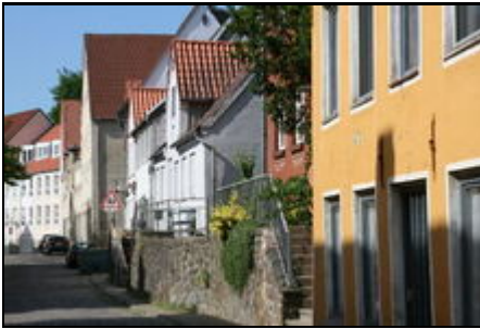
Haus in historisch geprägter Straße