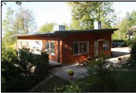
Außenansicht mit Terrasse und Balkon