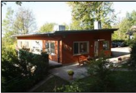
Außenansicht mit Terrasse und Balkon