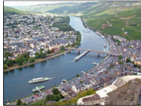
Blick auf Bernkastel-Kues

Bernkastel-Kues liegt im Herzen der Mittelmosel. Sie finden hier die moseltypischen Fachwerkbauten und können sich in zahlreichen Museen die Geschichte der Region anschauen. Bezaubernde Landschaft, hübsche Straußwirtschaften, gute Gastronomie, Wander- u. Radwege. Ausflüge nach Trier, Luxemburg, zur Edelsteinstadt Idar-Oberstein oder auch eine Tagesfahrt nach Paris bereichern Ihren Urlaub. Die nahegelegene Eifel mit Vulkanseen lockt zum Wandern und Baden. Der Maare-Mosel-Radweg beginnt 100m entfernt von uns. Einen Fahrradverleih für kleinere oder größere Touren finden Sie gleich um die Ecke. Für Ihre eigenen Räder haben wir einen Abstellplatz in unserer Garage.