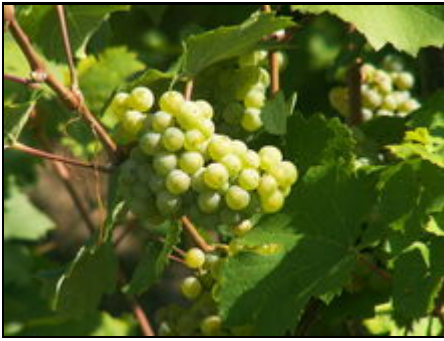
Wein und Wohlgefühl